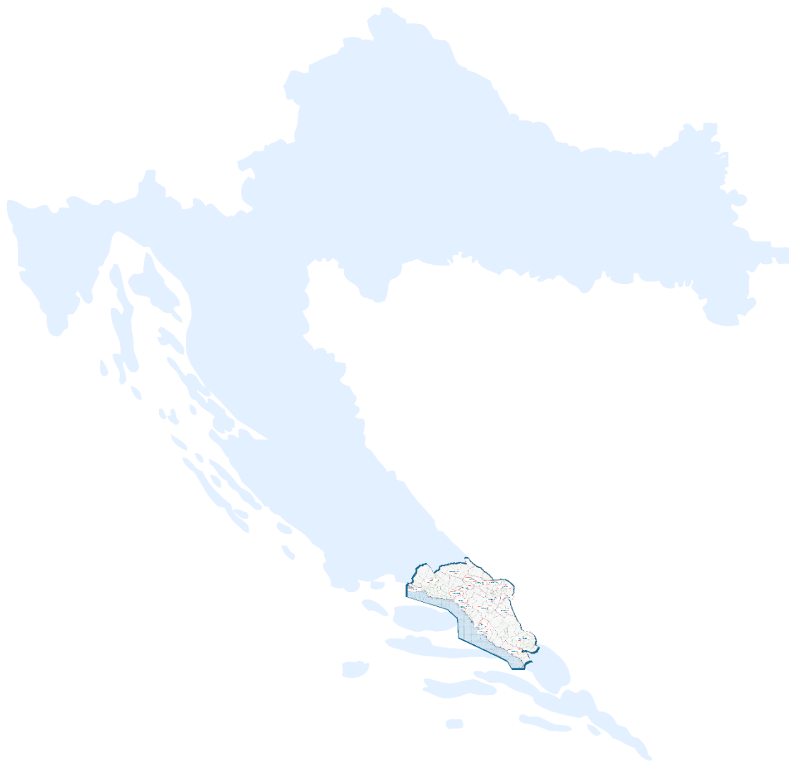
Slika 2: Karta položaja LAG-a na karti Republike Hrvatske